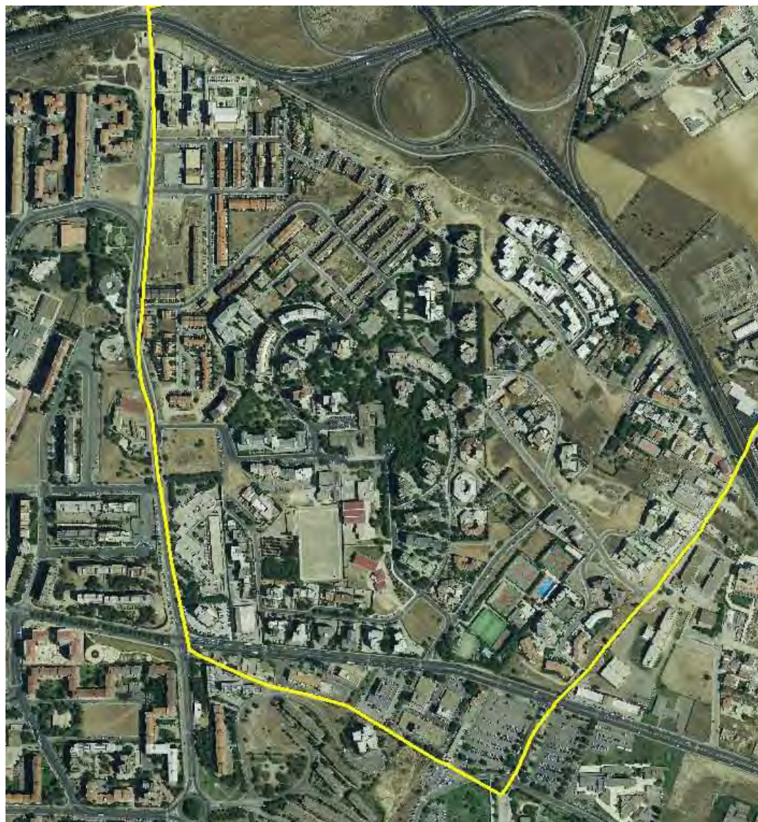
Quartiere Su Planu su ortofoto 2008

Il quartiere Is Corrias si è sviluppato a partire dal nucleo edilizio spontaneo sorto negli anni sessanta/settanta del secolo scorso. Nel 1986 è stata quindi perimetrata l'area da assoggettare a PRU che è entrato in vigore nel 1992 ai sensi della L.R.23/1985. Il Piano attuativo è suddiviso in unità convenzionabili esclusivamente residenziali (UCR), esclusivamente artigianali/commerciali (UCD), esclusivamente per servizi generali (UCG) più due unità miste, residenziali e per servizi generali (UCR/G). Le unità a destinazione D e G sono in adiacenza alla S.S.554 o allo svincolo a quadrifoglio con la S.S.131dir.