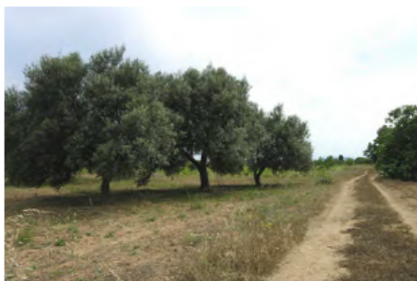
Oliveto in località Su Coddu de Pitzus.