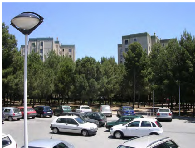
Vista dal basso del quartiere Su Planu.