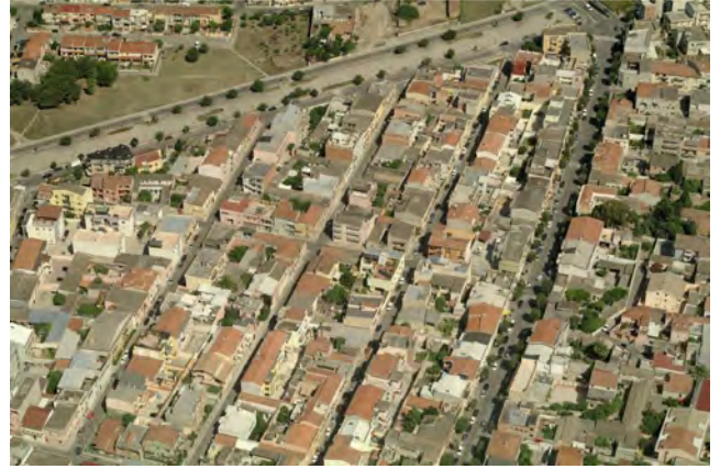
Vista obliqua dall'alto della maglia regolare della Zona Urbanistica Omogenea B in adiacenza alle Zone C attuate