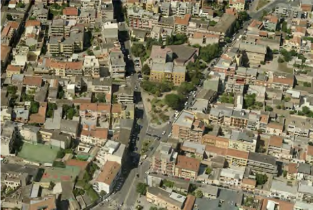
Vista obliqua dall'alto della zona centrale di Selargius, Zona Urbanistica Omogenea B in adiacenza alla Zona A