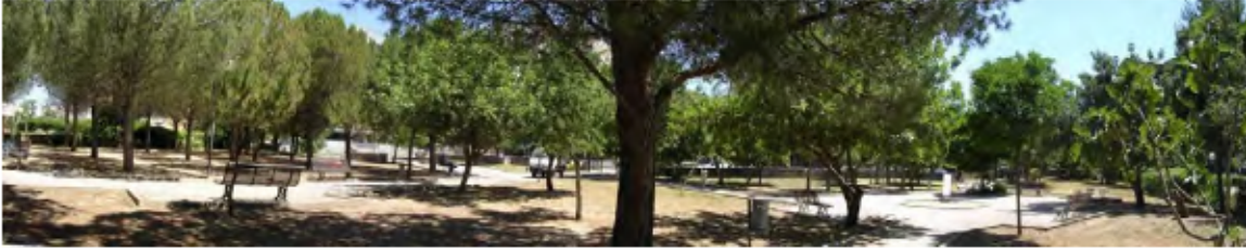
Vista dal basso del parco in Via Boiardo nel quartiere Su Planu.