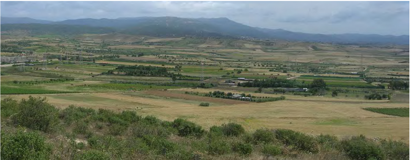
Vista da Cuccuru Matt' e Masonis verso est con lo sfondo delle montagne di Burcei.