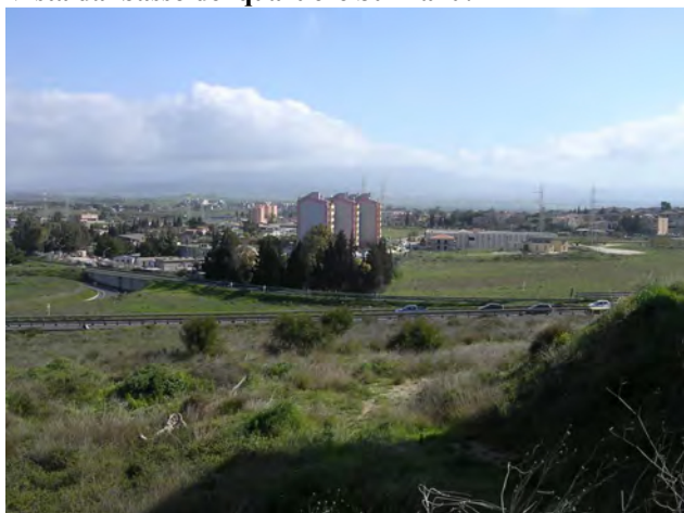
Vista dal quartiere Su Planu dello svincolo a quadrifoglio e del quartiere Is Corrias nello sfondo.