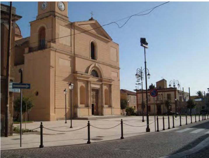
Chiesa Maria Vergine Assunta

Il Centro di Antica e Prima Formazione del Comune di Selargius (oggetto di ripermetrazione e copianificazione con la Regione Sardegna, con Determinazione RAS n°1444/DG del 10/12/2007) fa parte dei sistemi insediativi medievali di Quartu Sant'Elena, Quartucciu, Selargius, Monserrato, Pirri, considerati dal PPR sistemi storici del paesaggio cagliaritano intorno ai compendi umidi del Molentargius.