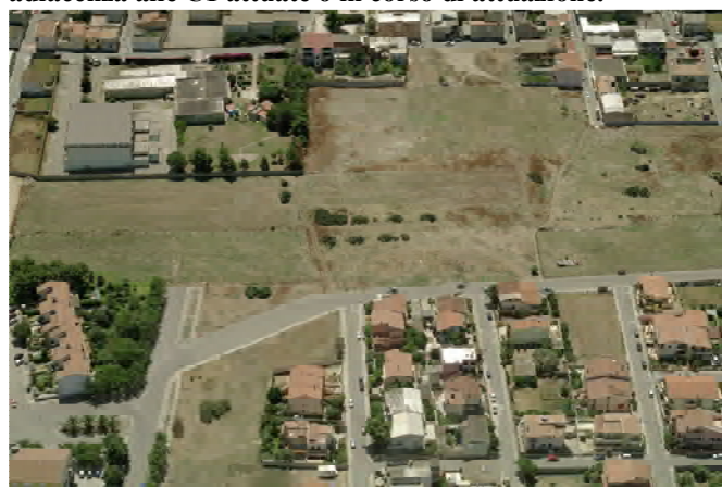
Vista obliqua dall'alto della Zona Urbanistica Omogenea C3.3, in adiacenza alle Zone B e C1 attuate e all'abitato di Quartucciu.