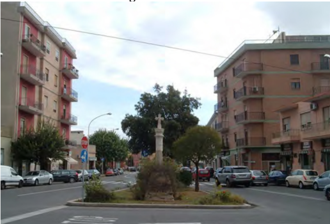
Vista dal basso della zona centrale di Selargius, Zona Urbanistica Omogenea B in adiacenza alla Zona A