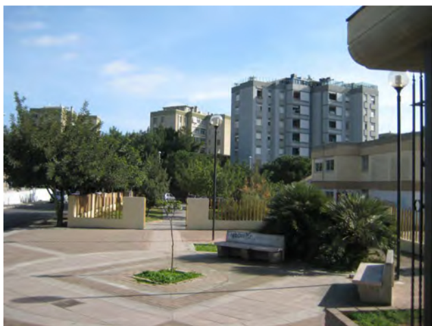
Vista dal basso del quartiere Su Planu.