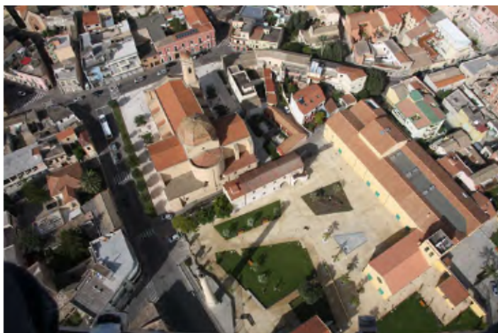
Complesso Si' e Boi

Il Complesso Si' e Boi invece fa parte del sistema delle archeologie industriali (in particolare del sistema del vino, con molteplici episodi di grandi cantine sorte tra '800 e '900 nella cintura dei borghi agricoli cagliaritani).