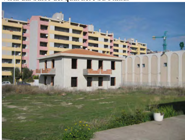
Vista dal basso del quartiere Is Corrias.

I prossimi interventi di eliminazione delle intersezioni a raso della S.S.554, correlati al rispettivo accordo di programma e quelli relativi alla metropolitana di superficie, interesseranno da vicino il quartiere Is Corrias, in cui migliorerà l'accessibilità al quartiere, su entrambi i lati della strada statale e quindi anche la vicinanza al centro della città di Cagliari, punti fondamentali per la riqualificazione delle periferie urbane.