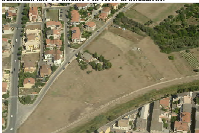
Vista obliqua dall'alto della Zona Urbanistica Omogenea C3.2, in adiacenza alle Zone B e C1 attuate.