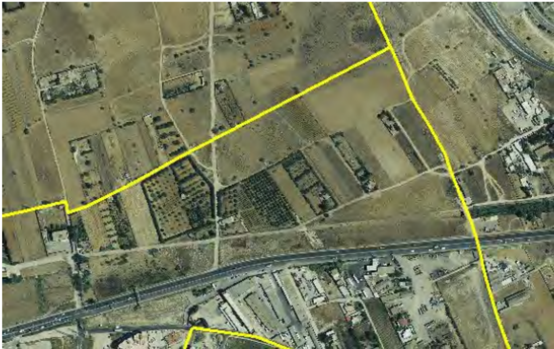
Area residua tra le infrastrutture di collegamento di prossima realizzazione su ortofoto 2008