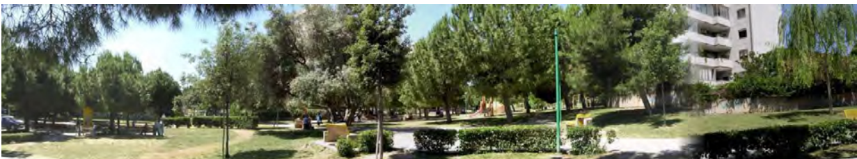
Vista dal basso del parco in Piazza Boiardo nel quartiere Su Planu.

Il disegno urbano di Su Palnu risulta essere ben delimitato fisicamente, in quanto in continuità con il quartiere cagliaritano "Mulinu Becciu", a ridosso della importante struttura sanitaria dell'Azienda Ospedaliera Brotzu, e risulta essere definito, in quanto quasi completamente attuato con un tessuto con alta densità residenziale, ma con tipologie edilizie a torre che consentono ampie aree libere, e con adeguati servizi pubblici, tra cui spiccano le aree verdi adeguatamente distribuite e fruibili, anche se non tutte sinora attuate.