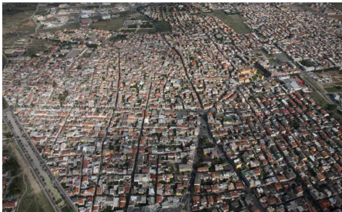
Centro matrice ed espansioni fino agli anni 50 delimitati dal Riu Nou ad ovest, dall'abitato di Quartucciu ad est e a nord dalla SS 554. Sullo sfondo oltre la SS 554 la Zona Industriale.