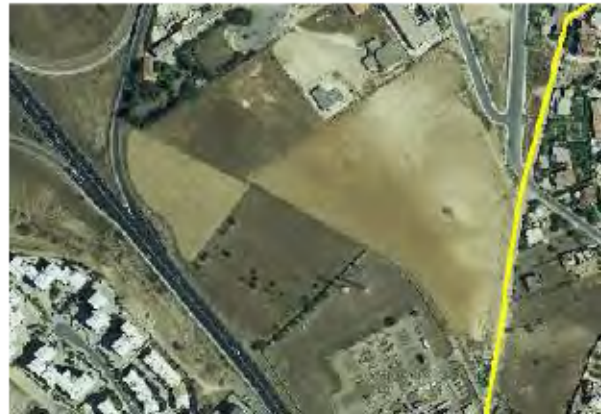
Area interclusa e incolta su ortofoto 2008

Nel PUC si prevede la realizzazione di un nuovo cimitero in località Su Pezzu Mannu, principalmente a causa dell’impossibilità di prevedere ulteriori ampliamenti del cimitero esistente oltre a quelli già pianificati, nonché per dotare di questo tipo di servizio i quartieri distaccati di Su Planu e Is Corrias.