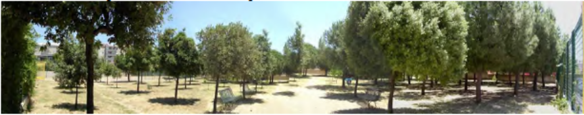
Vista dal basso del parco in Via Machiavelli nel quartiere Su Planu.

Il disegno urbano di Is Corrias invece risulta essere non ben delimitato fisicamente, in particolare sul lato nord del comparto nord del PRU, poiché diverse unità di intervento risultano non essere convenzionate. I Comparti Sud ed Est confinano con il quartiere cagliaritano “Barracca Manna” e sull’estremità sud è ubicata la sottostazione dell’ENEL, separata dal Piano di Risanamento da un’area incolta di circa 5 ettari, che secondo le previsioni di PUC sarà destinata a zona di espansione (G). Tale previsione consentirà di utilizzare un’area residua per: