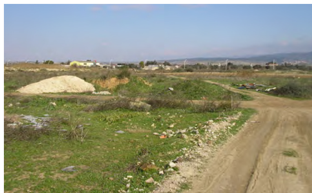
Vista dal basso della Zona Urbanistica Omogenea E2, in adiacenza alle C1 attuate o in corso di attuazione.