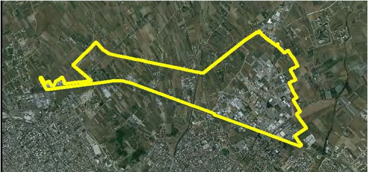
Perimetrazione Ambito 3 su ortofoto 2006

L'attuale area industriale, commerciale e artigianale del Comune di Selargius è ubicata in adiacenza alla S.S.554 e immediatamente al di sopra del nucleo più compatto del centro abitato principale, attraversata dalla strada (ex S.P.76) di collegamento con i Comuni di Settimo San Pietro, Sinnai e Maracalagonis e in adiacenza al territorio comunale di Quartucciu.