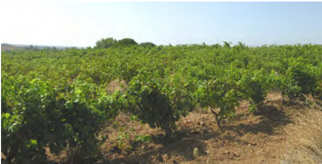
Vigna in località Bacu Lau.