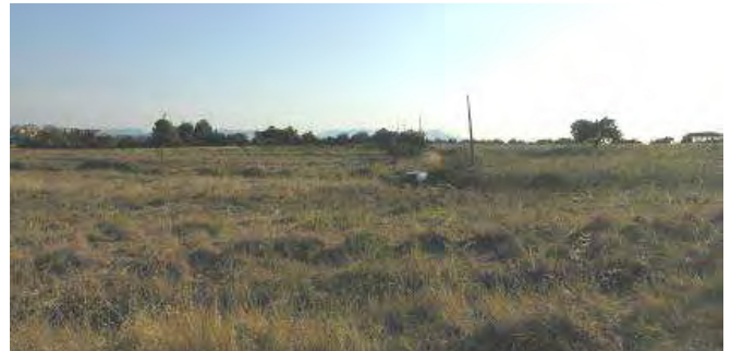
Incolto in località Cuccuru Serra.

Gli studi, i progetti e le azioni poste in essere dall'Amministrazione Comunale per l'agro selargino e richiamati nell'ambito n°4 del PUC riguardano chiaramente anche l'ambito n°5 del PUC.