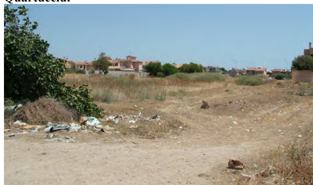
Vista dal basso della Zona Urbanistica Omogenea G1.36, in adiacenza alle C1 attuate.