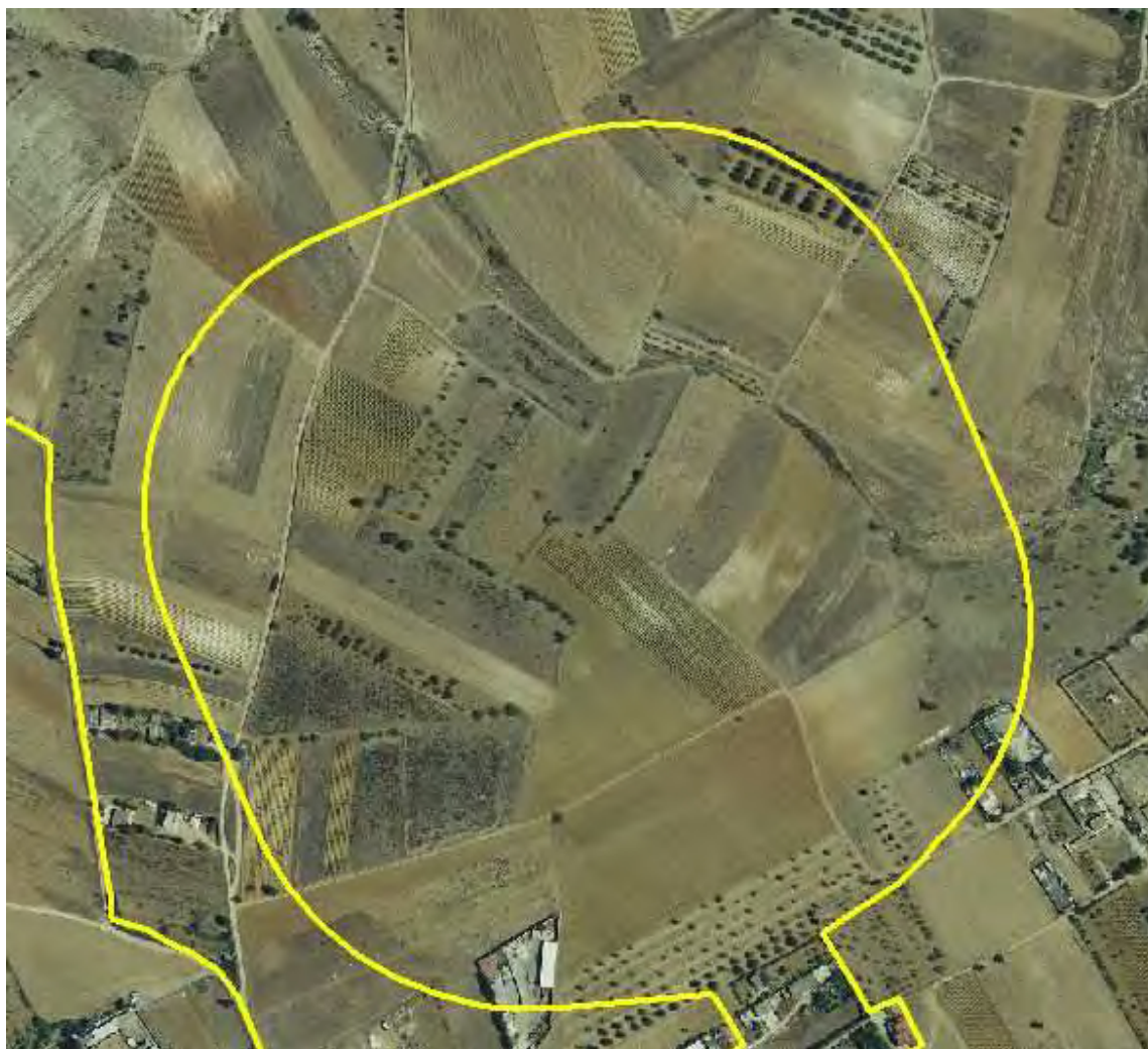
Area per il nuovo cimitero su ortofoto 2008

Nelle vicinanze del quartiere è presente la struttura della Cittadella Universitaria e Policlinico di Monserrato di rilievo sovralocale, quindi il PUC di Selargius in un'area di 11,7 ettari, interclusa tra la viabilità di prossima realizzazione (di collegamento tra la S.S.554 e il Policlinico di Monserrato) e la rete della metropolitana di superficie (che in quel tratto correrà parallela alla S.S.554) prevede la formazione di un piano attuativo per servizi generali, di iniziativa pubblica o privata, attivabile eventualmente anche attraverso la definizione di accordi sostitutivi ex art.11 della L.241/90 per l'attuazione di un comparto comprendente anche la sottozona G1.8.