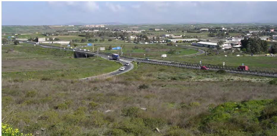
Vista dal quartiere Su Planu dello svincolo a quadrifoglio.

E' stata prevista la possibilità di mantenere in condizioni decorose le vaste aree interessate dallo svincolo a quadrifoglio, grazie alla loro acquisizione al patrimonio comunale e grazie al loro utilizzo per opere di mitigazione del rischio idraulico, di fondamentale importanza a scala sovralocale per permettere la percorribilità dall'importante nodo stradale.