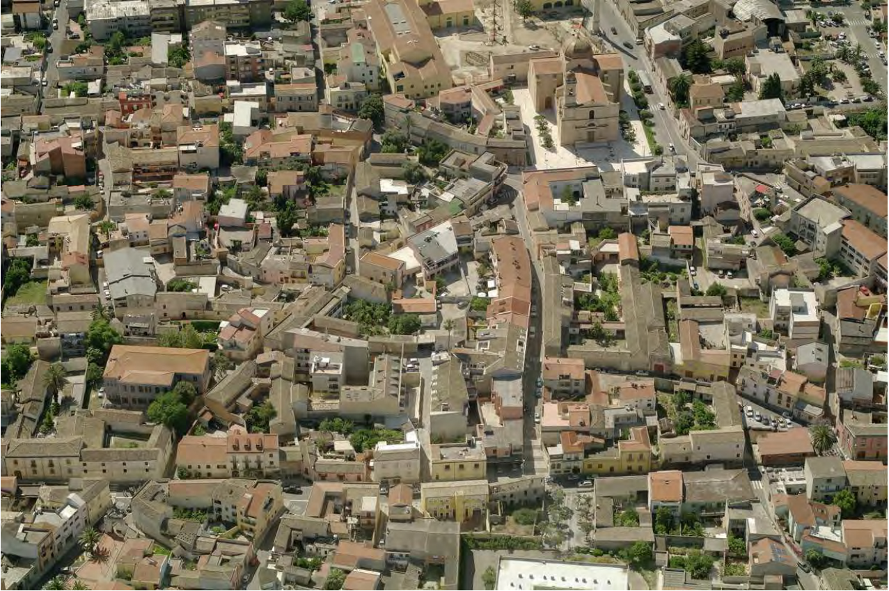
Vista obliqua dall'alto del nucleo storico