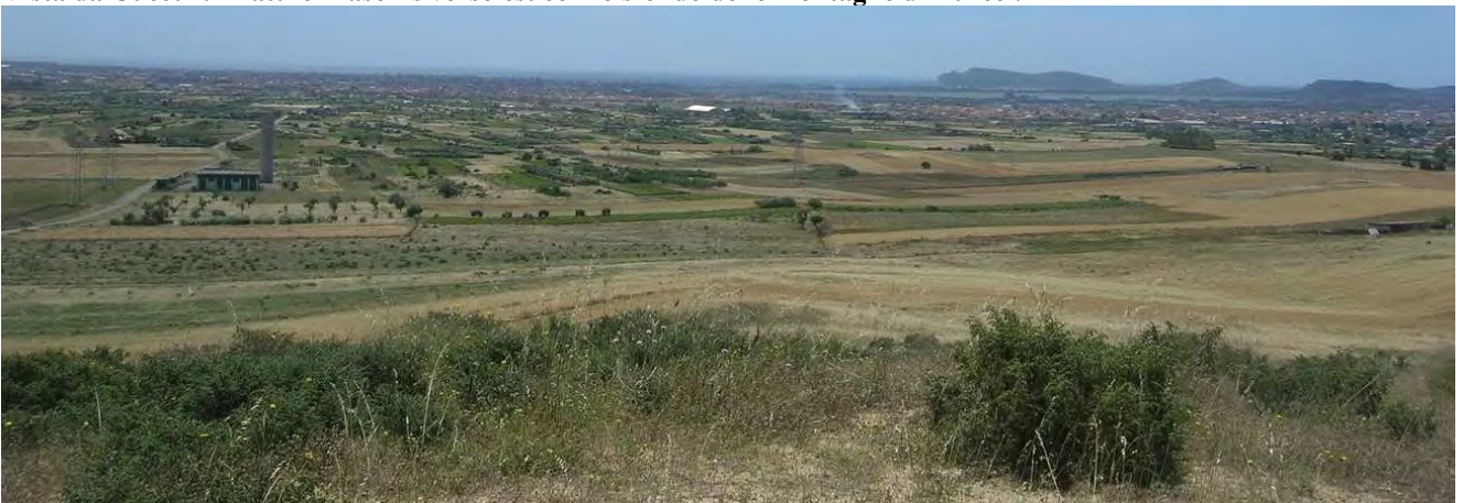
Vista da Cuccuru Matt' e Masonis verso sud con lo sfondo dell'abitato, della sella del diavolo e del mare.