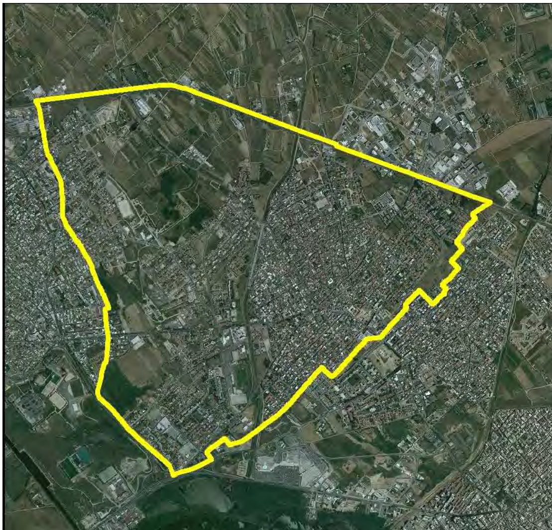
Perimetrazione Ambito 1 su ortofoto 2006

Il centro abitato originario di Selargius si è sviluppato intorno al nucleo storico ed è delimitato a sud, est e ovest dai limiti amministrativi comunali, in adiacenza con gli abitati dei comuni limitrofi, Monserrato (ad ovest) e Quartucciu (ad est), mentre a nord la linea di precisa delimitazione è data dalla infrastruttura viaria della S.S.554.