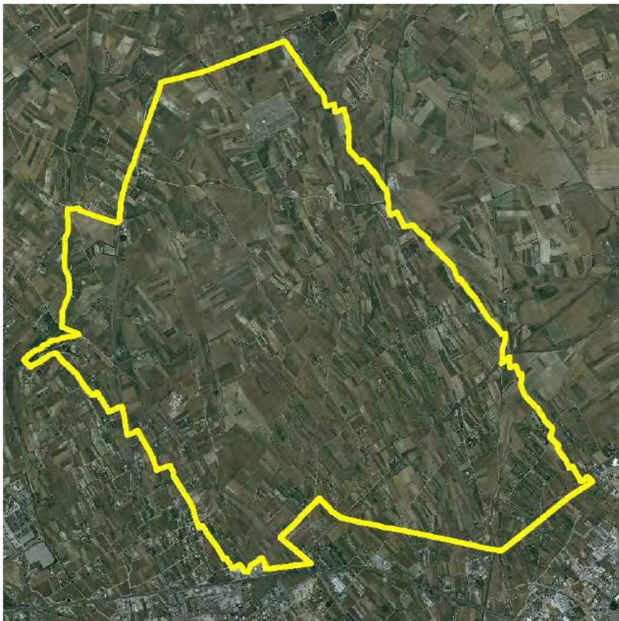
Perimetrazione Ambito 4 su ortofoto 2006

L'area agricola in esame è caratterizzata: