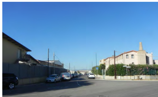
Viste dal basso di alcune vie della Zona Industriale, Artigianale e Commerciale di Selargius

La S.S.554 è già ora di rilevante importanza per la distribuzione dei flussi di traffico nell'area metropolitana di Cagliari e ancor di più lo sarà in un futuro prossimo, a seguito del completamento della S.S.125 (su cui confluiscono i flussi di traffico provenienti dall'Ogliastra e dal Sarrabus-Gerrei),