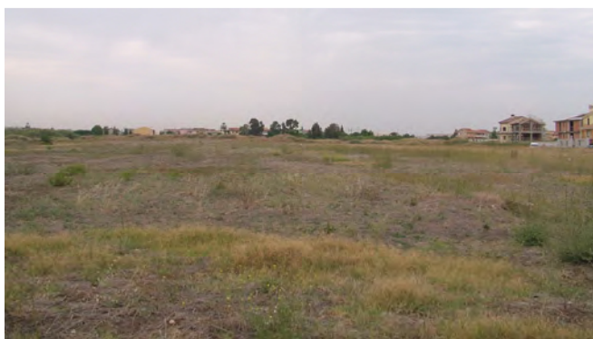
Vista dal basso della Zona Urbanistica Omogenea E2, in adiacenza alle C1 attuate o in corso di attuazione.