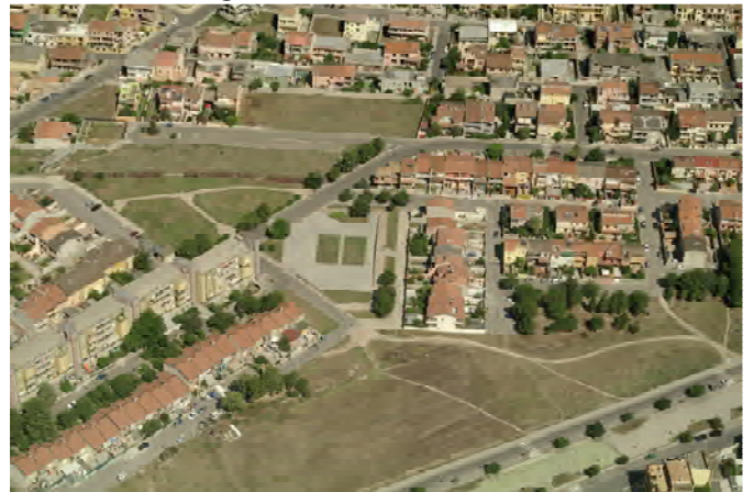
Vista obliqua dall'alto della Zona Urbanistica Omogenea C quasi completamente attuata. Le aree libere sono le aree per standard pubblici (attuate, in corso di attuazione e non attuate).

Le aree inedificate intercluse tra l'edificato e/o tra l'edificato e la S.S.554, aree che attualmente danno a chi entra nell'abitato di Selargius una percezione di degrado ambientale, sono state ripensate in parte nel PUC come oggetto di trasformazione al fine di migliorare la situazione paesaggistica e ambientale, non solo delle aree in questione, ma anche di altre destinate a servizi per l'abitato selargino consolidato e tutt'oggi irrisolte per carenza di fondi pubblici, utilizzando eventualmente la leva dell'attivazione degli accordi sostitutivi del provvedimento finale (ex art. 11 della L.241/90). Sono state quindi individuate delle Zone C3 ed una Zona G1 per la localizzazione di servizi a scala sovracomunale, compatibili con la residenza.