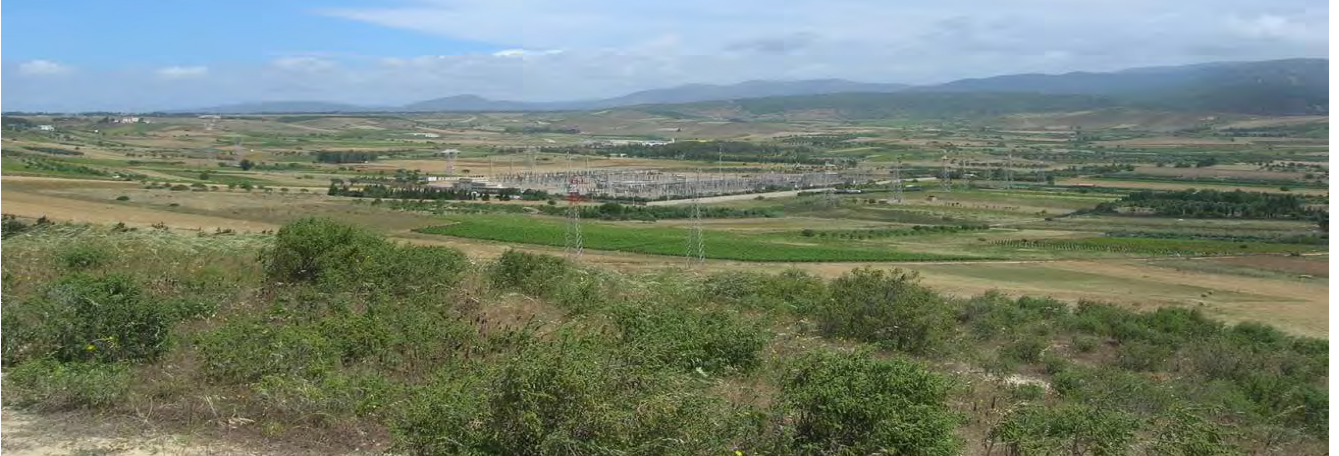
Vista da Cuccuru Matt' e Masonis verso nord-est da cui è riconoscibile la sottostazione dell'ENEL.