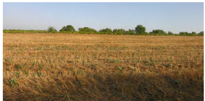
Seminativi in località Bacu Lau.