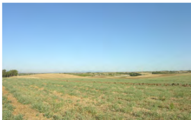
Seminativi e incolti in località Cuccuru Sonnu.