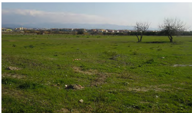
Vista dal basso della Zona Urbanistica Omogenea E2, in adiacenza alle C1 attuate o in corso di attuazione.