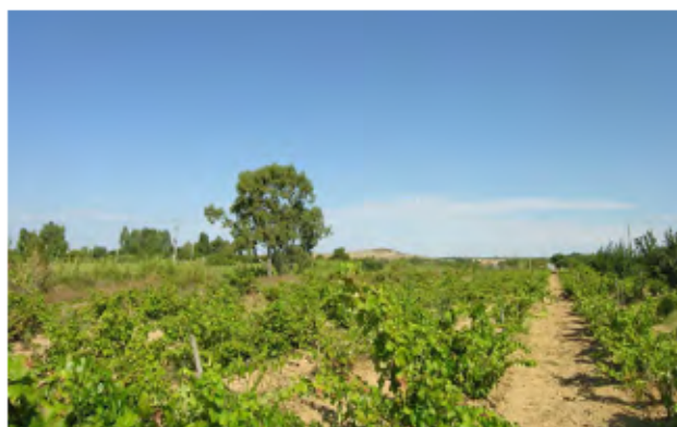
Vigna in località S’Ecca Lepuris.

Nel PUC, tenuto conto della classificazione del DPGR 228/1994 e a seguito degli studi di natura geologica, agronomica e dell’uso del suolo, l’agro è stato suddiviso in due sottozone per cui quella in esame è stata classificata come sottozona E1, caratterizzata da una produzione agricola tipica e specializzata.